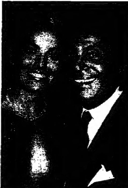
اليسار: م. صمد الزيات / الفنتازيا

ما تزال نجمة هوليوود الاستثنائية شارون ستون، تملأ الدنيا وتضلل الناس، وتسمى الابواب، وتكثف بمخيلات عشاقها نحو القاصي الشهرة والحنين، وسيبقى الفن السابع يكتسب، يشغف، الفصول الساخنة من حياة هذه النجمة التي تجذب عشاقها كما تجذب عظمها الذي يفرض عن الاحتمال ويكثف بالرغبات التي غالبا ما تتراقق مع شهقة متنامية تنهض عن تشقق الحلق والاصابع.